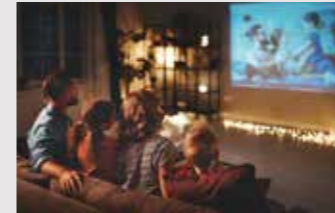
■リビングにホームシアター