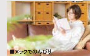
■ヌックでのんびり