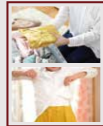
■ファミリークローク