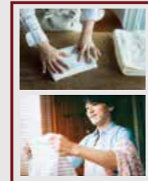
■ランドリースペース (干して～たたんで)

リビングで一家団楽。 ときには「ヌックやフリースペース」でのんびり過ごす時間もいいものです。