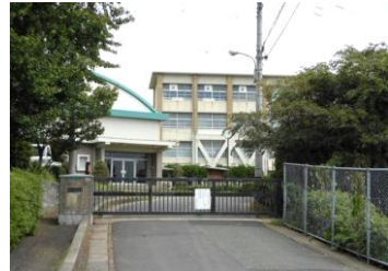
■中間東中学校 約2,560m（徒歩32分）