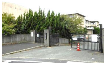
■中間東小学校 約1,680m（徒歩21分）