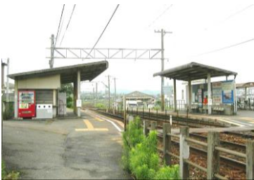
■筑豊鉄道【希望が丘高校前駅】約240m（徒歩3分）