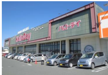
■ハローデイ中尾店 約1,120m（徒歩14分）