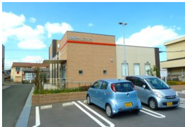
■中間クリニック 約370m（徒歩5分）