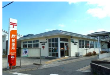
■土手の内郵便局 約400m（徒歩5分）